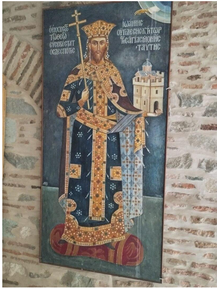
савремена фреска деспота Угљеше у манастиру Симонопетра