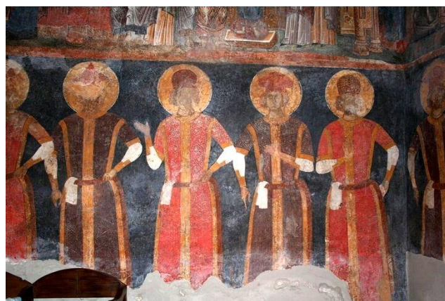
Фреска Небеског двора у Марковом манастиру, светитељи у одежама властеле