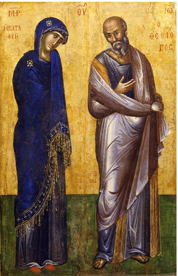
Маричка икона - Богородица Катафиги и Свети Јован Богослов