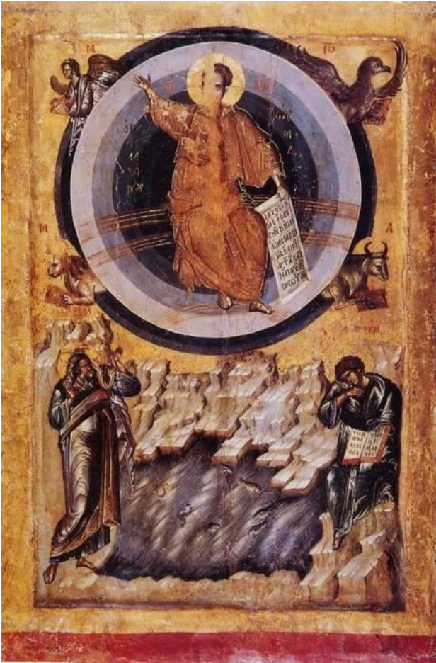
Маричка икона - Чудо у Латому