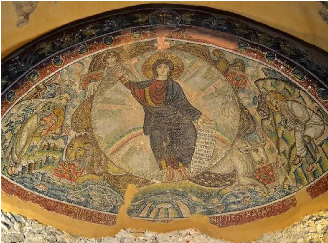
Солунски мозаик Чудо у Латому

дејствовало чудо молитве. Опитна јављања Светог Георгија, Светог Саве и Стефана Немање са анђелским војскама у одсудним тренуцима плашила су завојеваче на српску земљу. Маричку битку треба сагледати из иконичне, обрнуте перспективе – она није завршена, већ ће бити завршена. Битка је претеча Армагедона и есхатолошки ће бити завршена Другим Христовим доласком, када ће Страшни судија нествореном светлошћу преобразити сав космос. Неспремним српским витезовима одузета је победа пред свитање, али ће витезови остварити есхатолошку победу у Дан Христов – Зору невичерњег дана . Турски страх о коме је пред Марицу толико писао Димитрије Кидон 19 – замениће тада страх Господњи . Победа на Марици је Османлијама била доказ надмоћи ислама над „неверницима“. Ипак, победа сабласно бљешти необичним луциферијанским сјајем – баснословно лака победа над надмоћним противником.