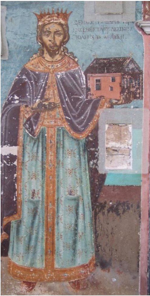
Ктиторска фреска деспота Угљеше у Храму Светих Козме и Дамјана у Ватопеду