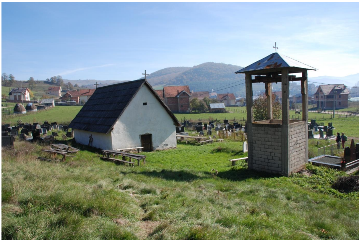
Савремени изглед Цркве св. ап. Петра и Павла у Тутину (из 16. века).