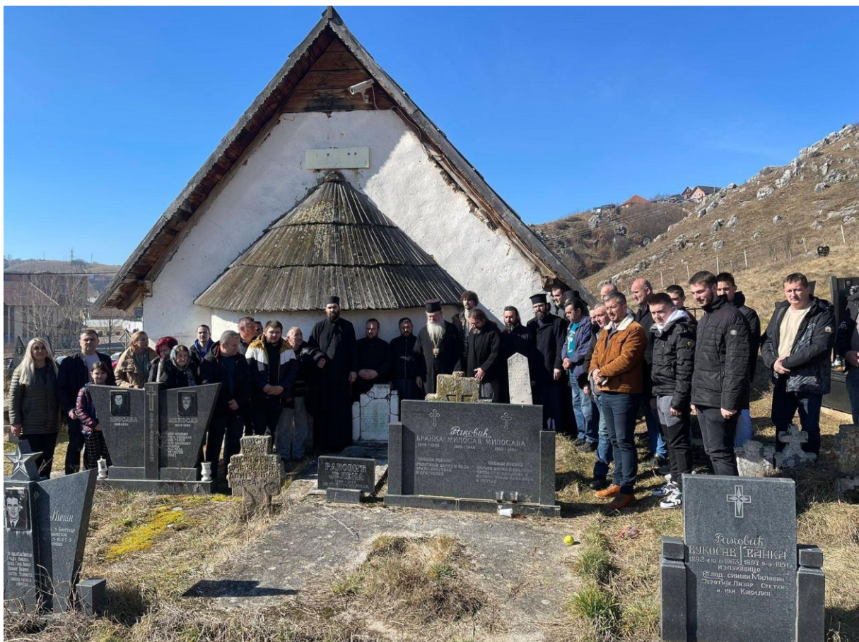
На гробовима Тутинских новомученика.