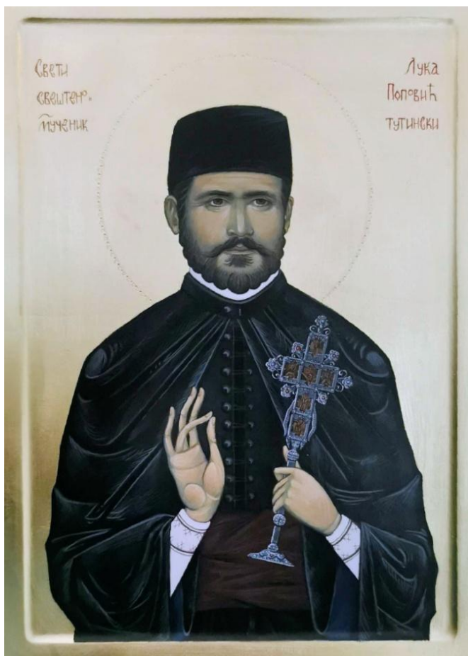
Св. свешт.муч. Лука (Поповић). Икона рад његове унуке Милице.