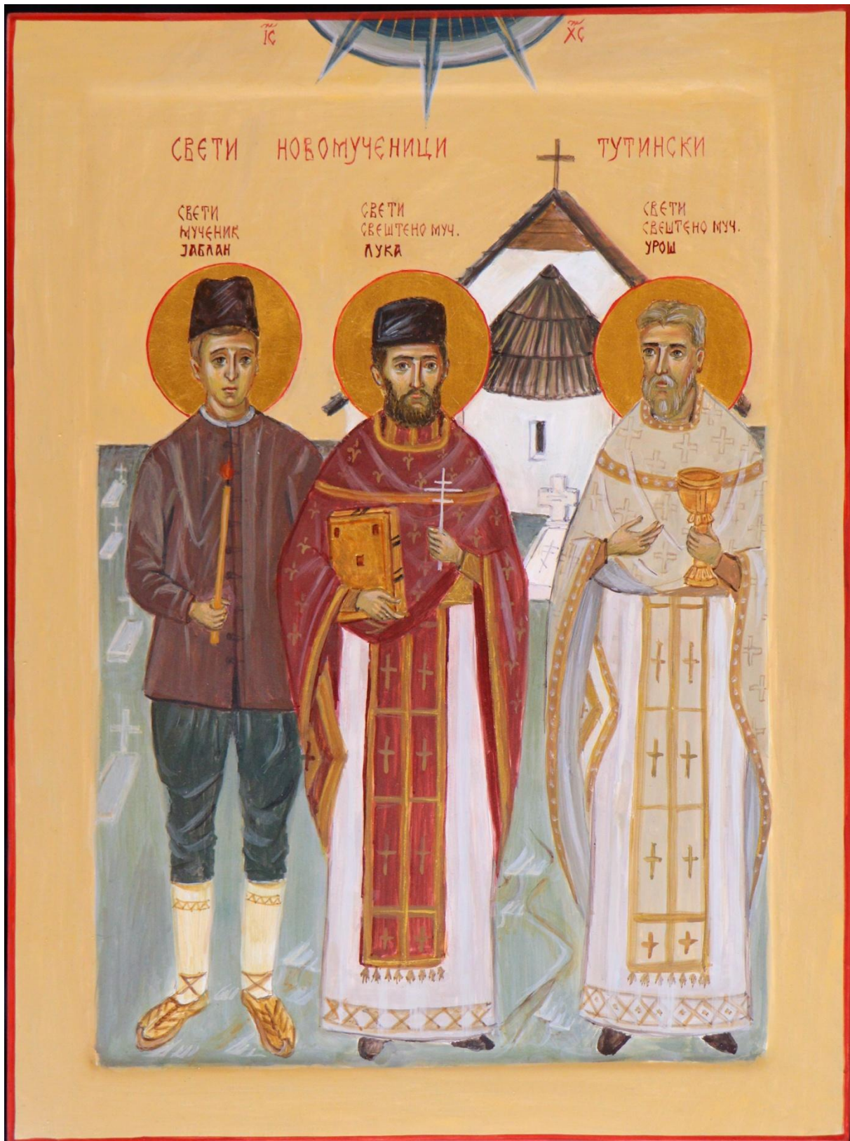
Икона Тутинских новомуч. Уроша и Луке (Поповића) – презвитера, и Јаблана (Раковића) – прквењакâ. Рад сестринства манастира св. вел.муч. Георгија у Брњаку, на Косову и Метохији.