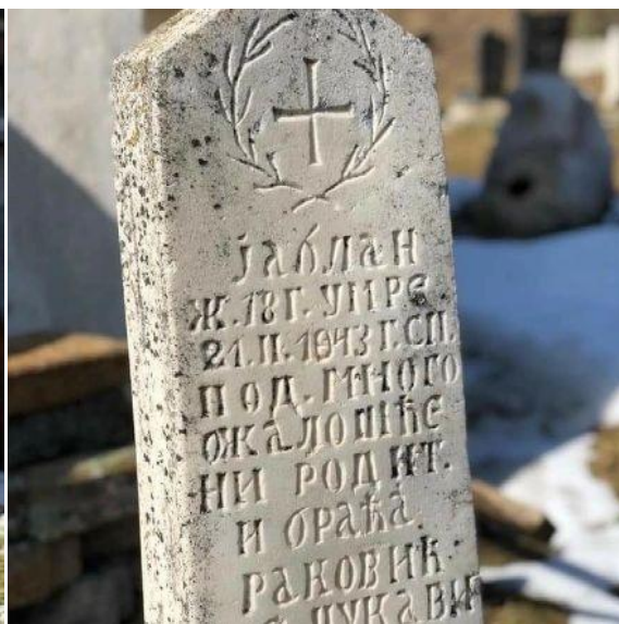
Црква св. ап. Петра и Павла, спомен плоча и надрогни споменици Тутинских новомученика.