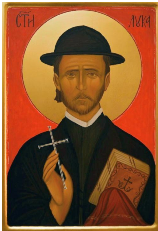
Св. свешт.муч. Лука (Поповић). Икона рад Луке Вирића.