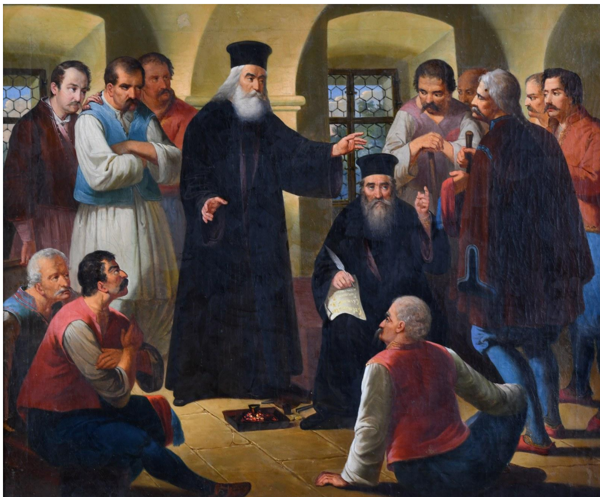
Хаџи-Рувим и Хаџи-Ђера – рад Павла Симића (уље на платну, 1849. год.) Стална поставка српске уметности 19. века, Галерија Матице Српске, Нови Сад.)

Њ иховим молитвама, Христе, Боже наш, помилуј и спаси нас. А мин.