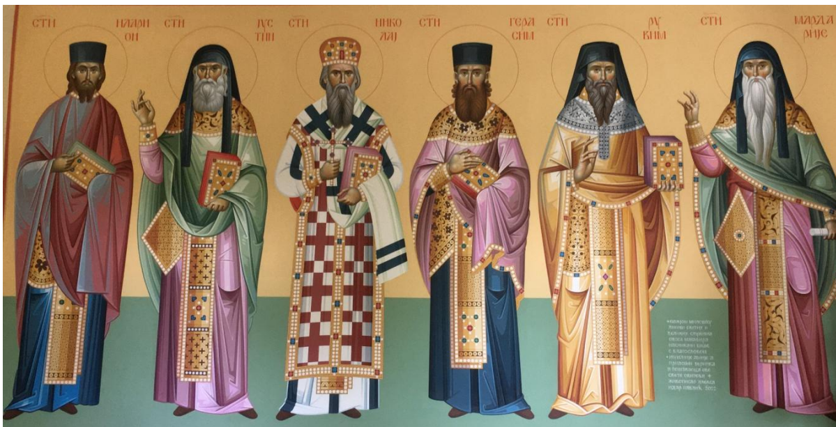
Свети Ваљевске епархије – савремена фреска у капели преп. Симеона Мироточивог манастира Боговађе, Ваљевска епархија СПЦ.