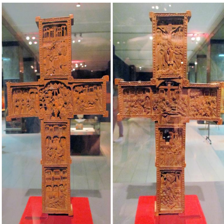
Дрворезбарени двострани крст, рад Хаџи-Рувима (1799. г.), манастир Чокешина.