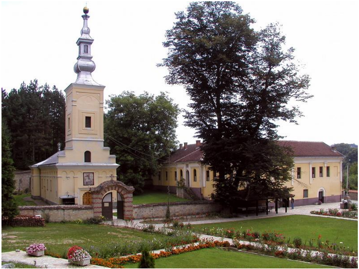
Савремени изглед манастира Бoгoвaђe, код Лaјкoвцa.