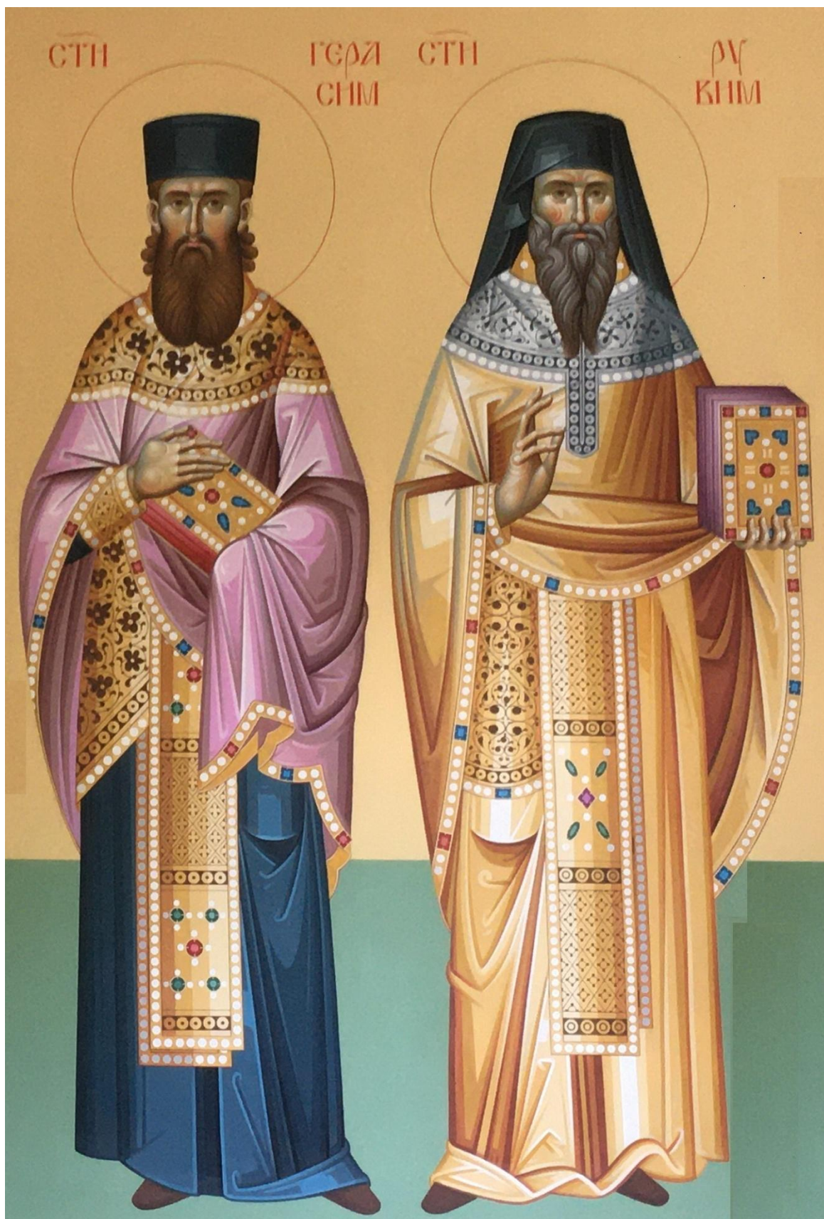
Нови преп. муч. хаџи-Герасим (Георгијевић) и хаџи-Рувим (Нешковић – Ненадовић) – детаљ савремене фреске у капели преп. Симеона Мироточивог манастира Боговађе, Ваљевска епархија СПЦ.