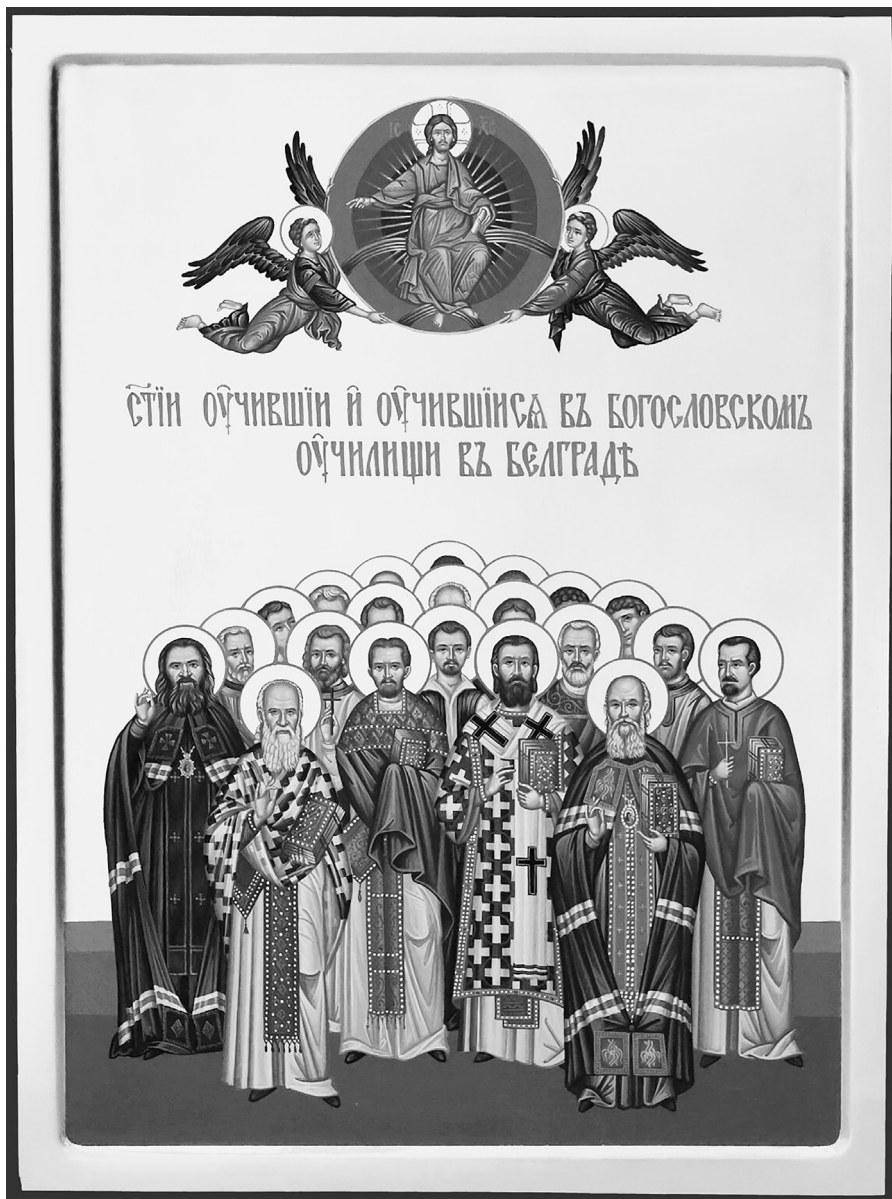
Сл. 1. Свѣији који су учили и који су се учили на Богословском училиишћу у Београду, икона, рад Миодрага Живојића

факултета насликани су у факултетском параклису, чије осликавање још увек траје. Најпре су у припрати осликани Свети Иринеј Бачки, Јустин Ћелијски, Јован Шангајски и Варнава Беочински, а недавно су њихови ликови још једанпут насликани у наосу параклиса, где је двојици богослова дато истакнуто