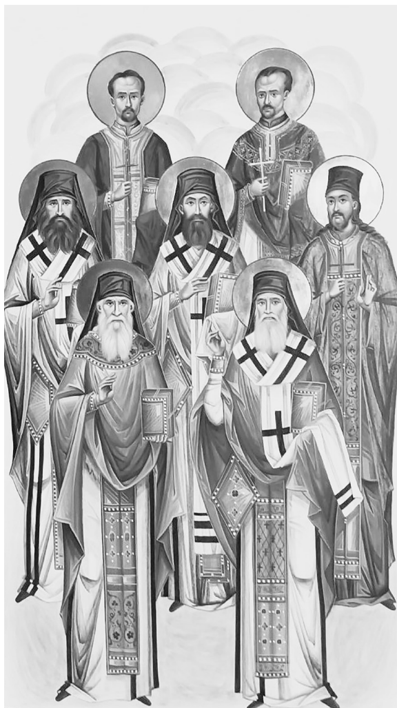
Сл. 2. Свети који су учили и који су се учили на Богословском училишту у Београду, икона, рад Веронике Ђукановић

Новоустановљени спомен Светих који су учили и који су се учили на Богословском училишту у Београду одговара типу саборних, заједничких спомена, односно спомена који обједињују свете једне групе (Сабор Светих праотаца, Сабор дванаесторице или седамдесеторице Светих апостола, Света три јерарха, Свети Атанасије и Кирило, Свети српски просветитељи и учитељи и други) или једне територије (примера ради, свака помесна Црква у другу недељу по Педесетници прославља саборни спомен својих светих). Почетком XXI века постојање саборних спомена посведочено је и у случају неких богословских училишта Руске Православне Цркве. О томе најбоље сведочи постојање Сабора Светих Кијевске духовне академије и семинарије. Уобличавање тог спомена текло је постепено. Најпре је 2012. године насликана икона светих и установљен богослужбени дан (27. октобар / 9. новембар). Потом је