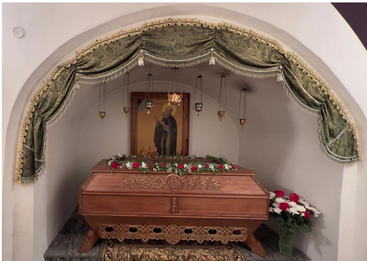
Кивот са моштима преп. Саве Крипецког у његовом манастиру.