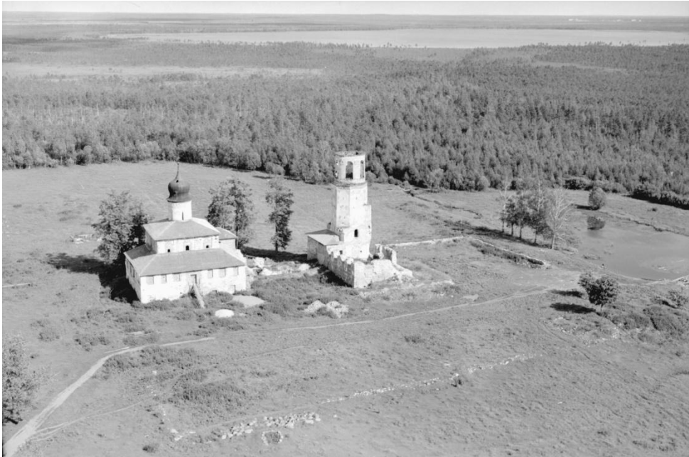
Крѣпецки Јовано-богословски манастир, 1963. г.

Въ пѣматѣ вѣчною бѣдетъ прѣвникъ, * Ѡ савха сла не оубоитса.* 16 ]