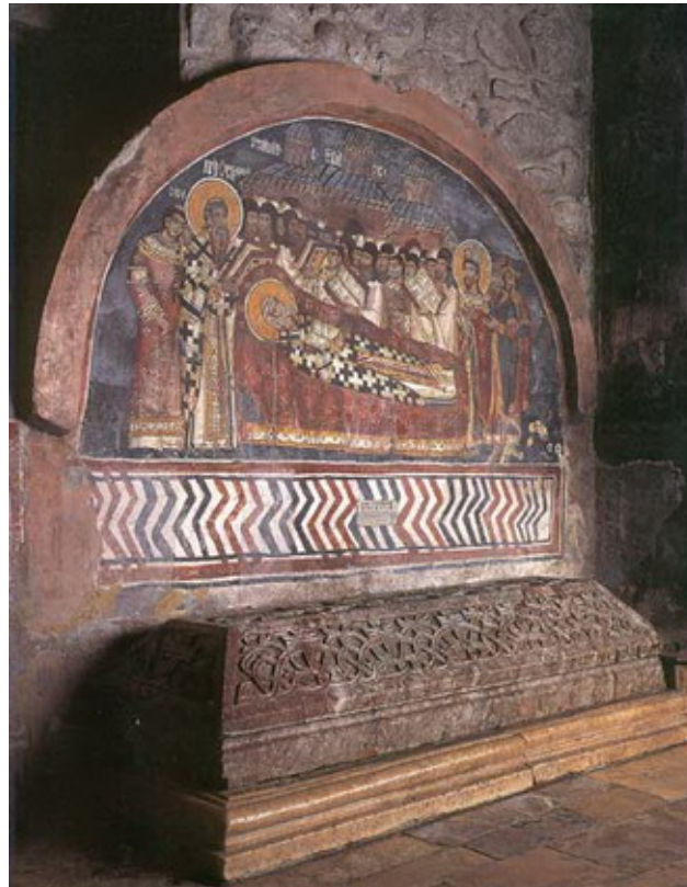
Кивот Св. Саве II у цркви Св. апостола, у манастиру Пећска Патријаршија.

И после овога пређе из овога живота на блажени и вечни покој, и би положено тело његово у дому Светих Апостола,* 10 где се светолепно и свечасно помиње и до сада. А успомена његова престављења је у осми дан месеца фебруара.