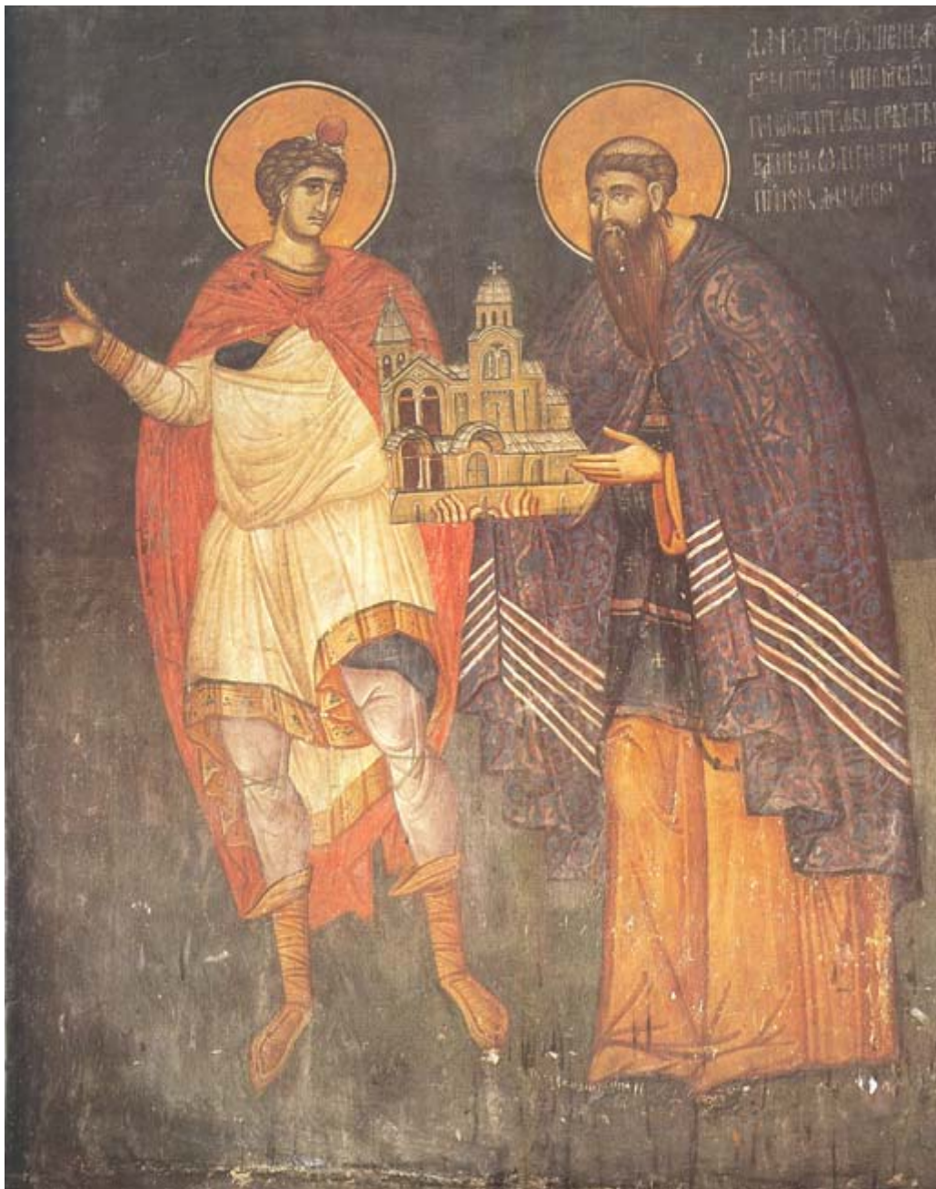
Свети пророк Данило приводи Пресв. Богородици свт. Данила II, архиеп. Србског (деталј ктиторске фреске у Цркви Богородице Одигитрије, у Пећској патријаршији, четврта деценија XIV в.).