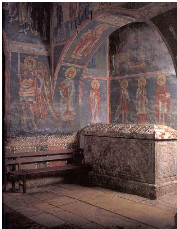
Гроб архиепископа Данила II у Цркви Богородице Одигитрије, у Пећској патријаршији 1337. г.).

Његовим молитвама, Господе Исусе Христе, помилуј и нас грешне, и удостој нас свом душом служити Теби кроза све векове. Амин.