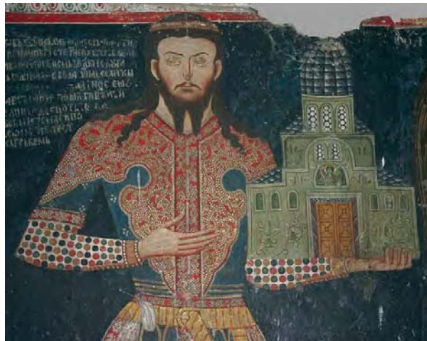
Деспот Јован Оливер у ктиторској композицији.