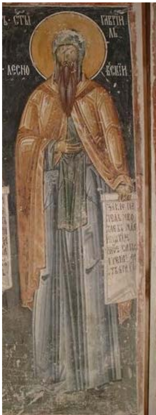
Део фреске преп. Прохор Пчињски и преп. Гаврило Лесновски, манастир Грачаница, спољна припрата. Сада у ман. трпезарији.