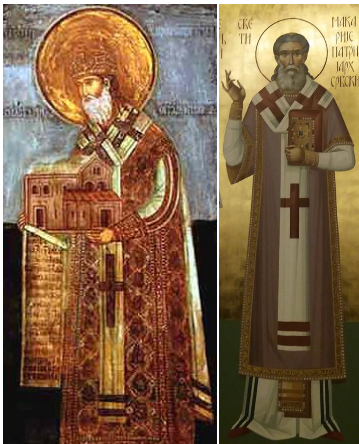
Свт. Макарије (Соколовић), патријарх Србски – фреска у Будисавцима, метоху Пећске Патријаршије, 17. век; и фреска у крипти спомен-храма свт. Саве на Врачару, Београд.