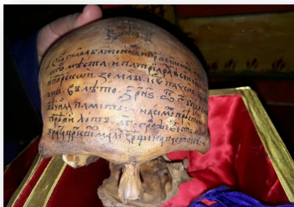
Мошти св. Пајсија у Пећкој Патријаршији